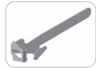
Leva avvita/svita ghiera TC 32 standard Standard TC 32 ring fixing/removing tool