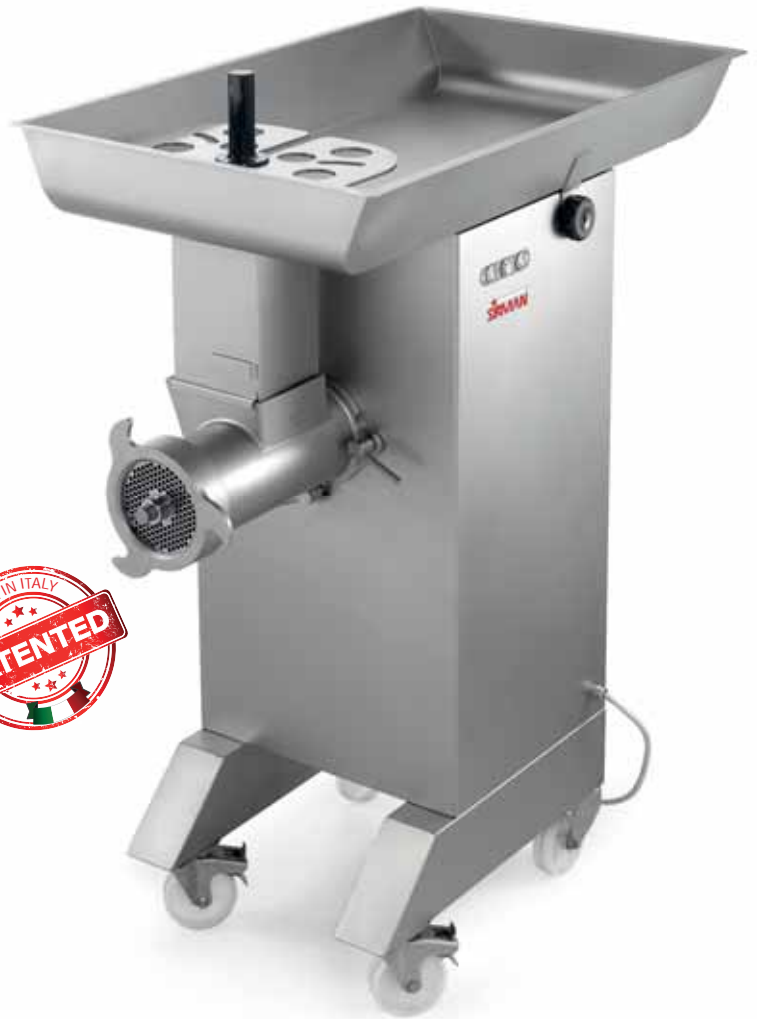
TC 42 MONTANA Y12