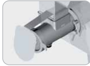
Opzionale: paraspruzzi Optional: splash guard