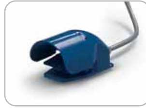
Pedaliera opzionale Optional pedal controls