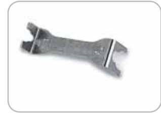
Estrattore piastre Plates removal tool