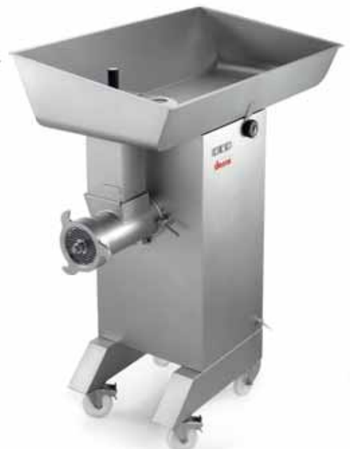
TC 42 MONTANA Y12 - TG