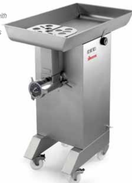
TC 32 MONTANA Y12