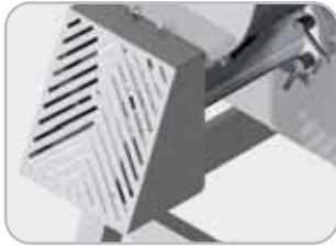
Opzionale: sistema di protezione interbloccato per uso piastre con foro > 8 mm Optional: interlock protection for more than 8 mm holes plates.