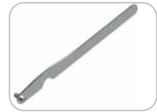
Leva avvita/svita ghiera TC 42 standard Standard TC42 ring fixing/removing tool